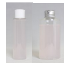
左…60mlボトル 右…130mlボトル