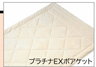
プラチナEXボアケット