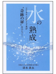
水の「熟成」 シリカナノコロイド水が“奇跡の扉”をひらく！ 清水教永著 (医学博士)