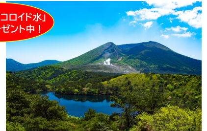
高千穂峰(霧島連峰)

からだもお肌もみるみる元気に！ 夢の熟成天然水 高濃度シリカナノコロイド水 Si-WATER (エスアイウォーター)