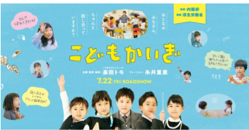
「子どもかいぎ」公式HP 絶賛上映中! https://www.umareru.jp/kodomokaigi/

映画を見て改めて感じたのは、子どもは本当に純粹で無邪気で眩しいほど輝いている存在だということ。どの子どもも個性的で愛らしい。人は多くの経験を経て、自己を確立していきますが、生まれながらにして備えていた「自分らしさ」は失ってはいけないなあと考えさせられました。人として生きる上で大切なことを再認識させられ、勇気づけられたようにも思います。自分という存在に原点回帰させてくれる素晴らしい作品です。あらゆる年代の方におすすめします!