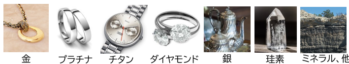
金 プラチナ チタン ダイヤモンド 銀 珪素 ミネラル、他

こんなシーンに☆ 寝具やカーテン、ソファ、ラグ、クッションに／クローゼットやシューズケースに／靴やスリッパ、帽子などに／衣類の静電気対策に／冷蔵庫や食糧庫の庫内に／電子レンジやグリル、トースターの内面に／キッチンやシンクまわりに／床や窓掃除の仕上げ拭きに など