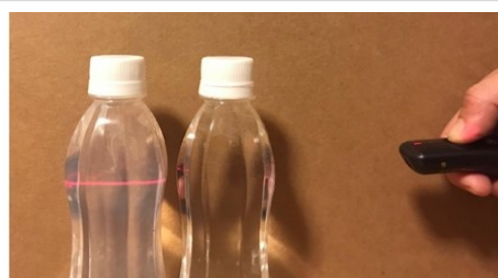
左)レーザー光が線状に見えるチンダル現象 右)ミネラル水にはこの現象は見られません

シリカは体内で生成することができず、年齢とともに減少します。20歳を過ぎた頃から徐々に減少し、高齢になればなるほどシリカ不足になります。